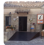
Enoteca comunale di Erice

Nel cuore di Trapani, la Sala Eccellenze del Territorio rappresenta un luogo di convivialità culturale e promozione dell'Erice DOC.