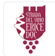
Associazione Strada del Vino Erice DOC