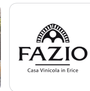
FAZIO Casa vinicola in Erice

Centro informazioni turistiche ed Enoteca comunale per la degustazione guidata dei vini del territorio Erice DOC.