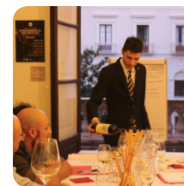
Museo San Rocco Sala Eccellenze del Territorio

La Strada del Vino Erice DOC è un sorprendente circuito enogastronomico che raccoglie enti pubblici ed aziende private.