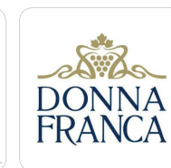
BAGLIO DONNA FRANCA